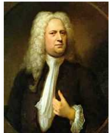
Georg Friedrich Häendel

Handel es uno de los compositores más importantes del barroco, siendo junto con su contemporáneo Bach, el más importante de la primera mitad del siglo XVIII. Nacido en 1685, en Alemania, en 1712 se iría a vivir a Inglaterra para consagrarse como uno de los mejores compositores británicos, consiguiendo en 1727 la nacionalidad británica. Es menester comprender que Häendel provenía de una familia rica y no tenía los impedimentos o limitaciones propios de la mayoría de los músicos. En 1759, con una gran reputación entre el círculo musical londinense, moriría a la edad de 74 años, siendo enterrado en la abadía de Weillmesiter.